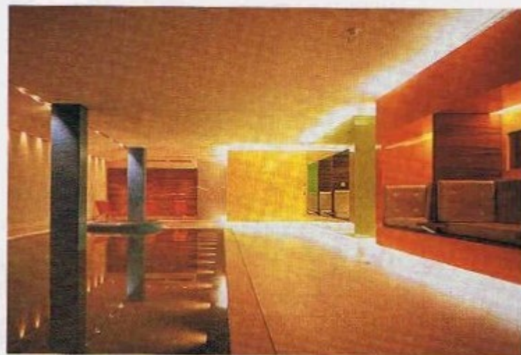
L'hotel Side, ad Amburgo (tel. 0049-40309990).

Si entra nella hall e si sente un delicato profumo. La stessa cosa avviene in ascensore e in altre aree. Il segreto è nascosto nelle pareti, che diffondono gli aromi. Lo scenario? L'hotel Side di Amburgo. Ma qui non viene stimolato solo l'olfatto, anche la vista, con colori brillanti. Per dormire e svegliare i sensi.